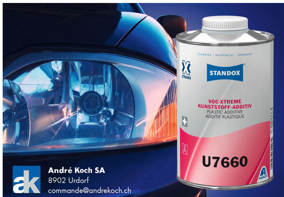
Légende de la photo : Le nouvel additif Standox VOC-Xtreme pour plastiques U7660